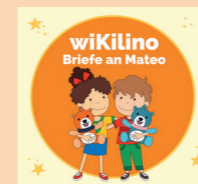
Materialkiste Briefe an Mateo