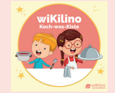
Materialkiste Koch was