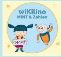
Materialkiste MINT & Zahlen