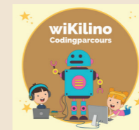
Materialkiste Coding Kita / Grundschule