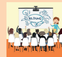
Präsenzs Schulungen zum wiKilino Material