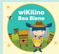
Materialkiste Bea Biene