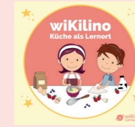
Materialkiste Küche als Lernort