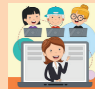
Digitalschulungen zum wiKilino Material