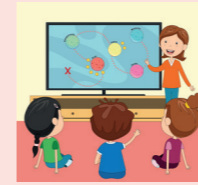
Workshop Mitmachkino Wohlfühlen