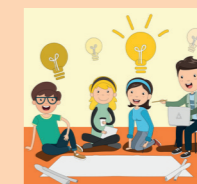
Schulungen für Ehrenamtliche / Eltern