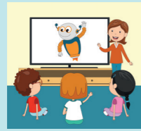
Workshop Mitmachkino MINT & Zahlen