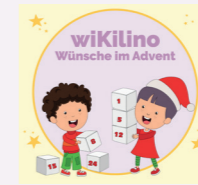
Materialkiste Wünsche im Advent