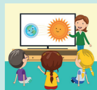
Workshop Mitmachkino Achtsamkeit