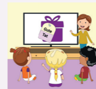
Workshop Mitmachkino Wünsche